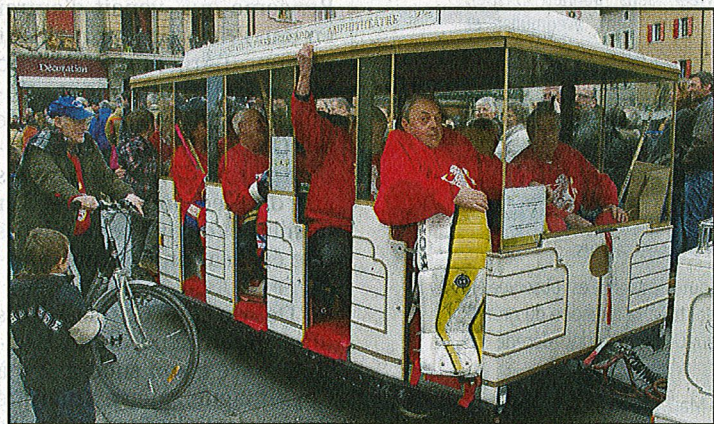
Une équipe est arrivée grâce au train Le Baladeur.