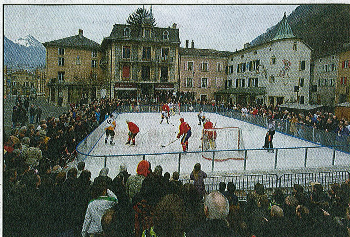
Entre 500 et 600 spectateurs s'étaient massés autour de la patinoire.

Quant au tirage au sort de la tombola, il n'a malheureusement pas encore désigné le vainqueur du maillot de Jimmy Martinetti dédié par tous les joueurs puisque le numéro tiré – le 1143 – n'était pas présent au moment du tirage. Son propriétaire peut se manifester auprès de Raphy Rouiller au 079 636 49 71. Le bénéfice de cette tombola est reversé à la Fondation Moi pour Toit.