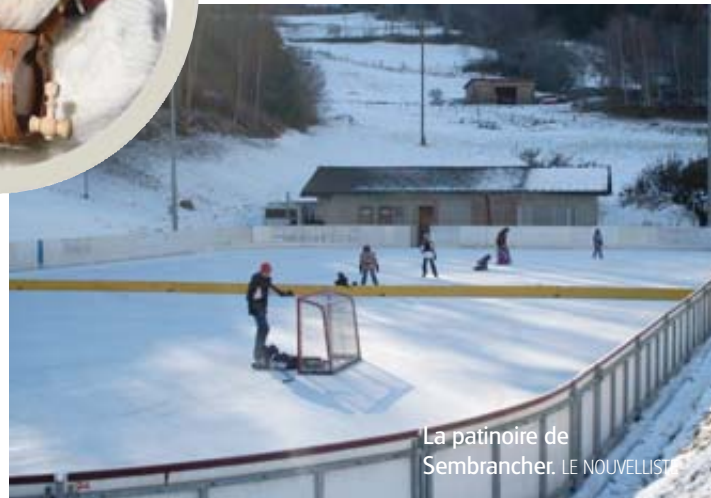
La patinoire de Sembrancher.