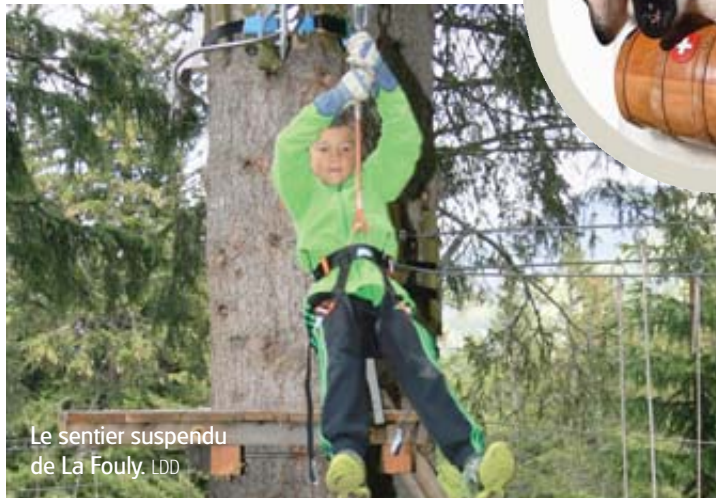
Le sentier suspendu de La Fouly.